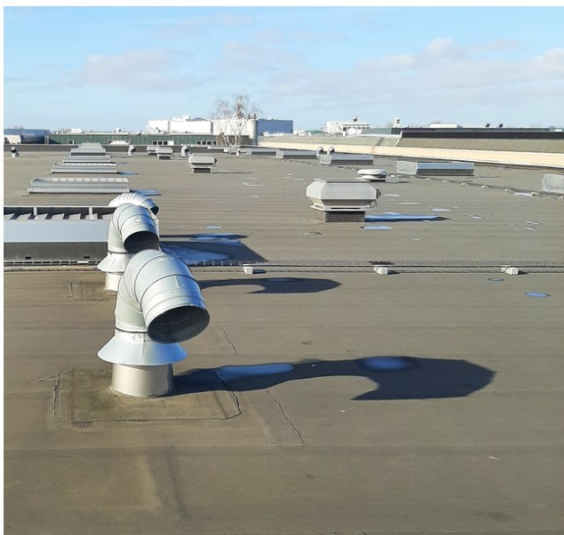
Bronnen van het geluid

Tijdens dit bezoek bleken er op het dak van het bedrijf meerdere uitlaten aanwezig, zoals op onderstaande afbeelding weergegeven.