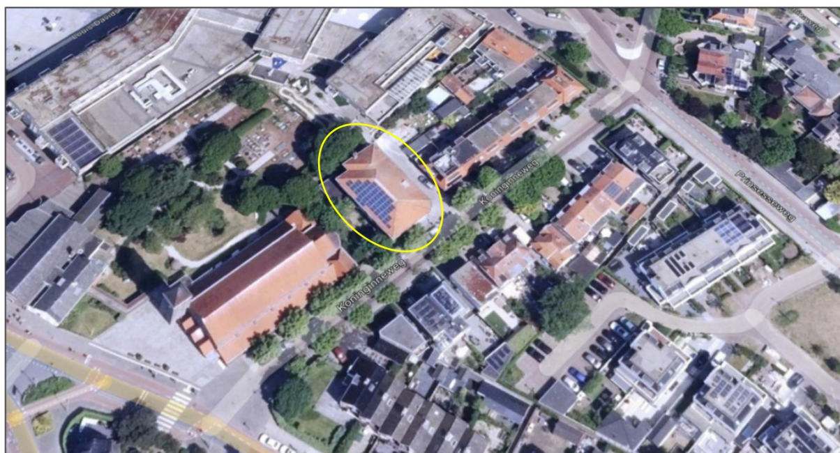
Afb 2: De locatie van de Mariaschool