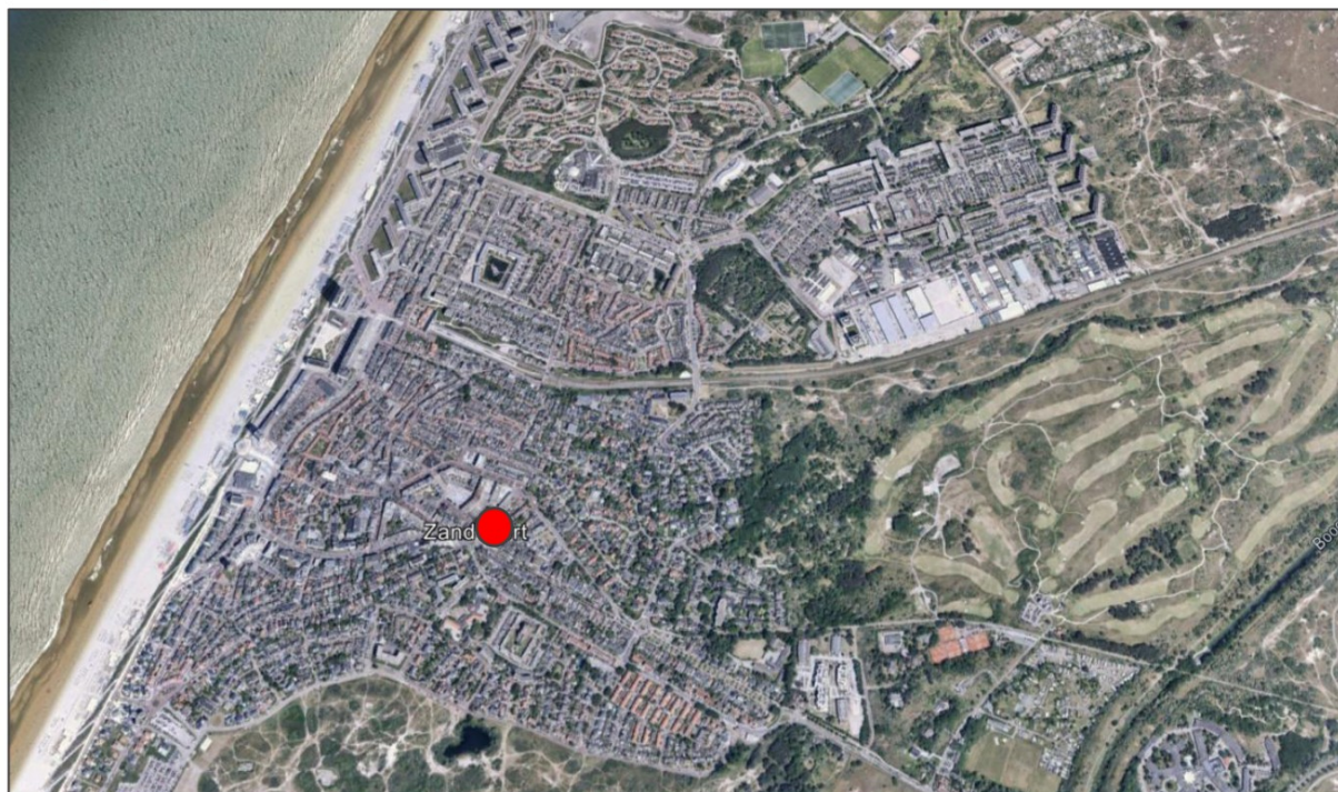
Afb 1: Projectlocatie, ligging in Zandvoort