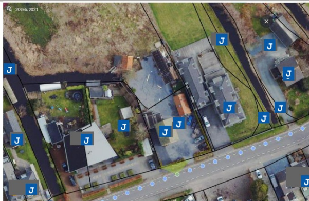
Situatie 20 februari 2021 – zonder stacaravan