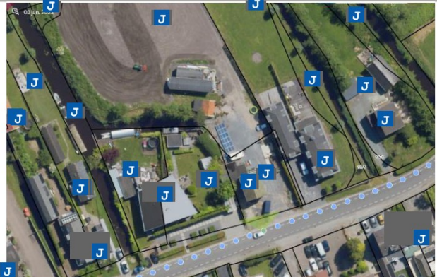
Situatie 3 juni 2022 – met stacaravan